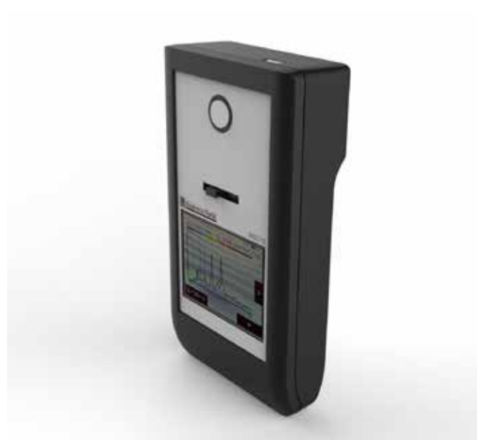
MSC15 zur Messung von Beleuchtungsstärke, Spektrum, Farbe und Farbwiedergabe in Rahmen der Beleuchtungstechnik

Die Beleuchtungsstärke von Phototherapieleuchten für Neugeborene zur Behandlung von Hyperbilirubinämie (Neugeborenenengelbsucht) kann gemäß aktuellen Standards und Leitlinien unabhängig von dem Lampentyp oder Hersteller präzise gemessen werden. Das MSC15 zeigt direkt die Gesamtbestrahlungsstärke für Bilirubin, Ebi ( \text{mW}/\text{cm}^2 ), gemäß dem Standard der Internationalen Elektrotechnischen Kommission IEC 60601-2-50:2009+A1:2016 sowie die durchschnittliche spektrale Bestrahlungsstärke für Bilirubin ( \mu\text{W}/\text{cm}^2/\text{nm} ) gemäß den neuesten Empfehlungen der amerikanischen Akademie für Kinderheilkunde (American Academy of Pediatrics) an.