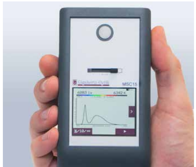
Tochscreen für die einfache und intuitive Bedienung des Geräts