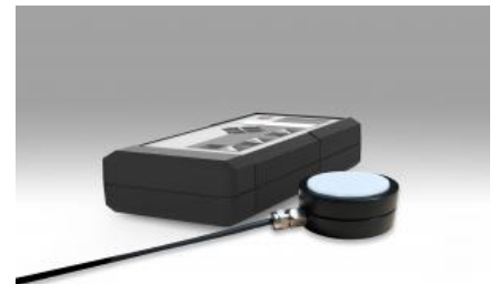
Luxmeter für sehr geringe Beleuchtungsstärken bestehend aus Optometer P-9710 mit photometrischem Messkopf VL-3707.